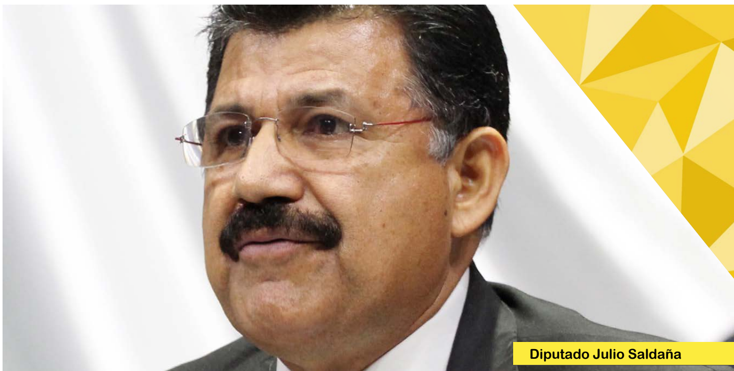
Diputado Julio Saldaña