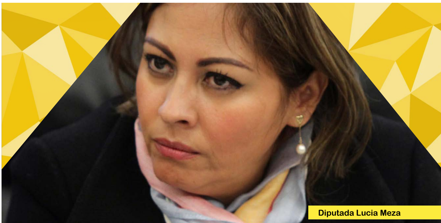
Diputada Lucia Meza