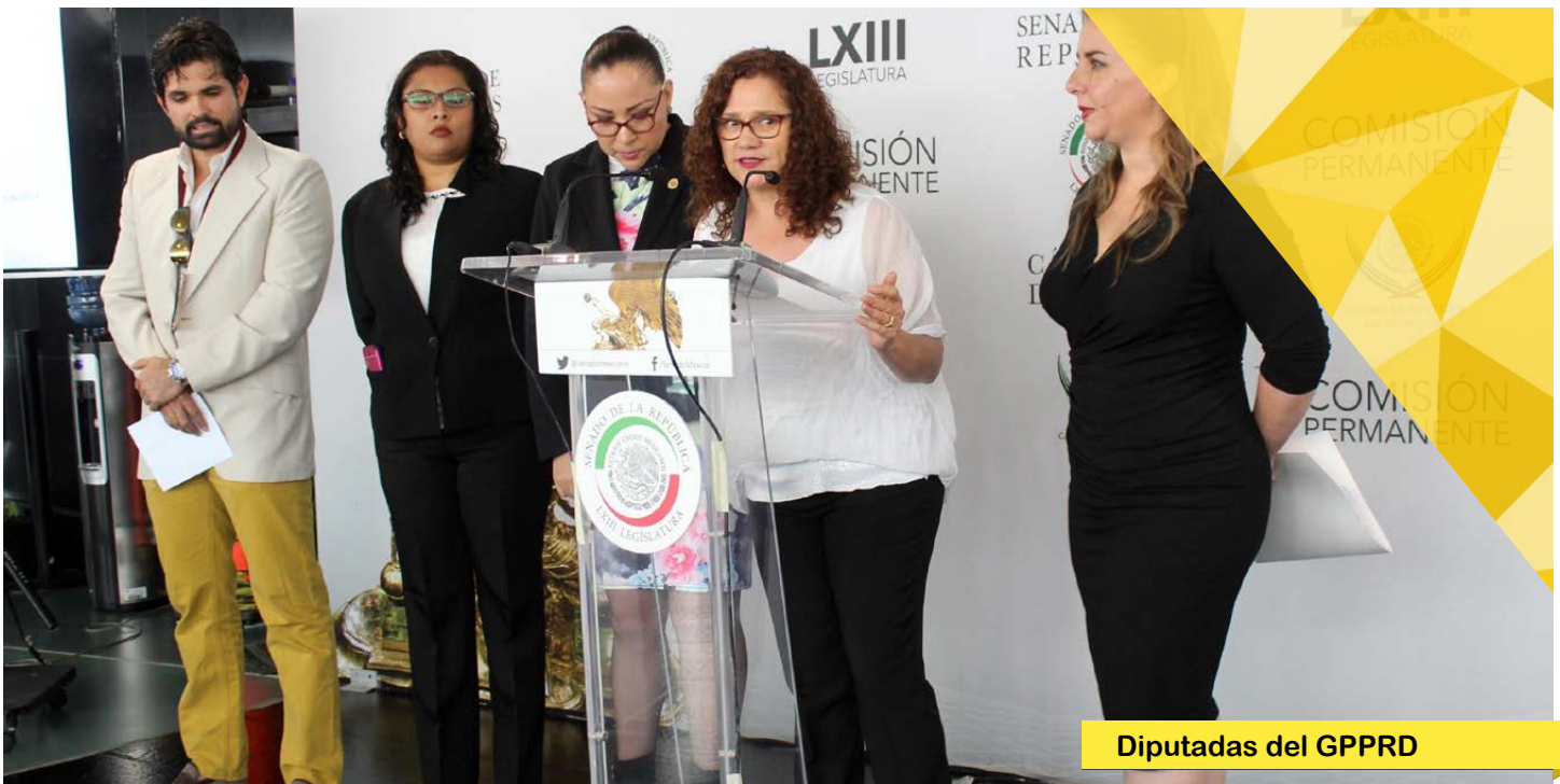
Diputadas del GPPRD