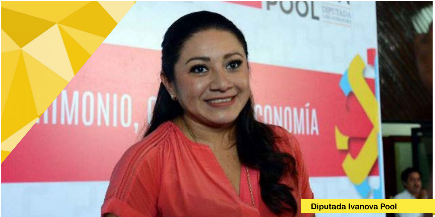
Diputada Ivanova Pool