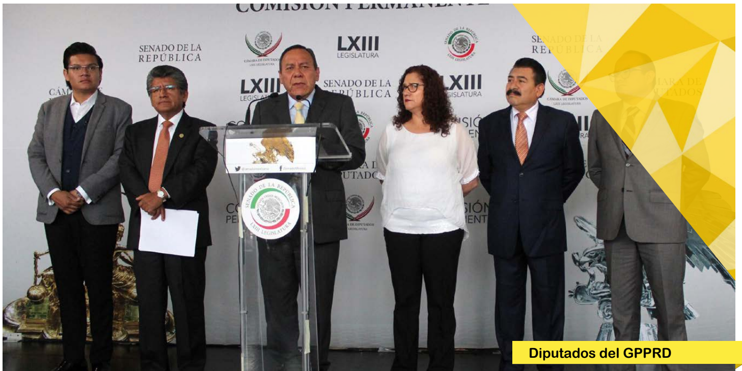
Diputados del GPPRD