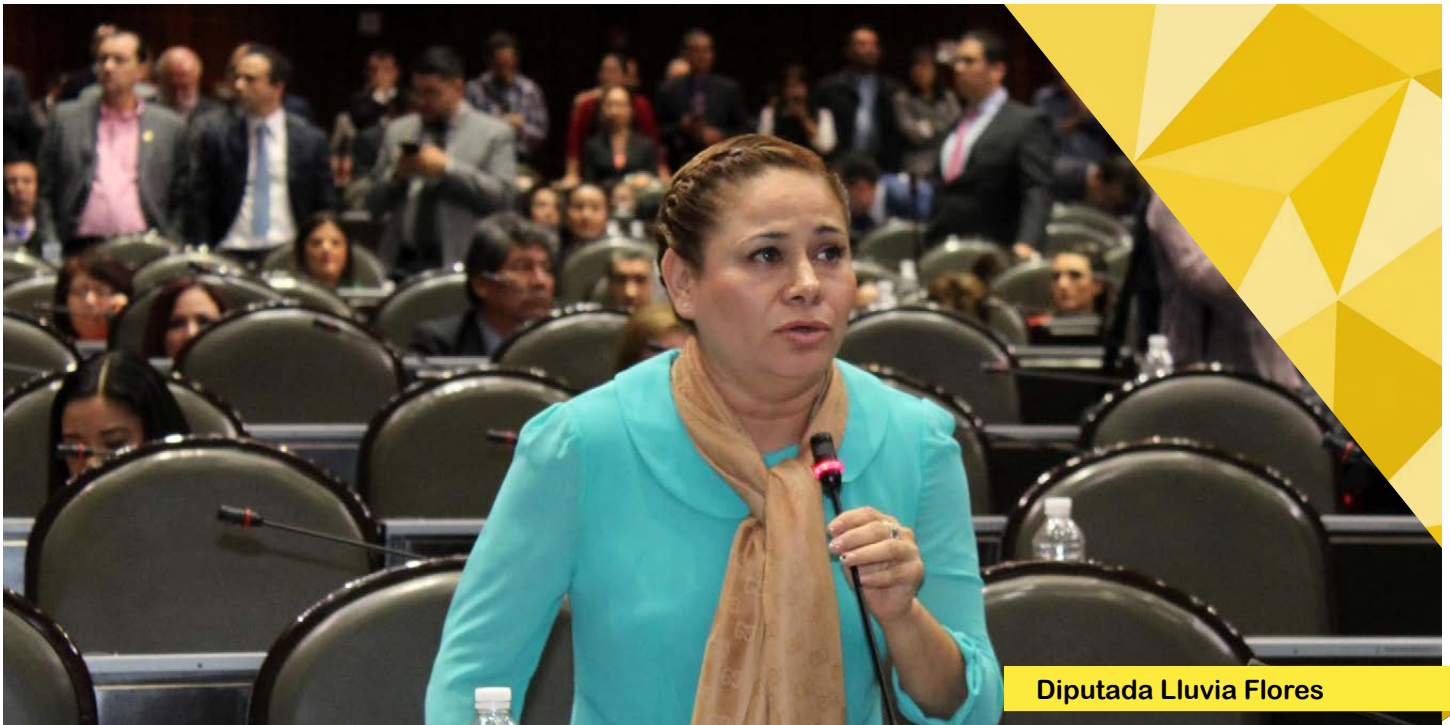
Diputada Lluvia Flores