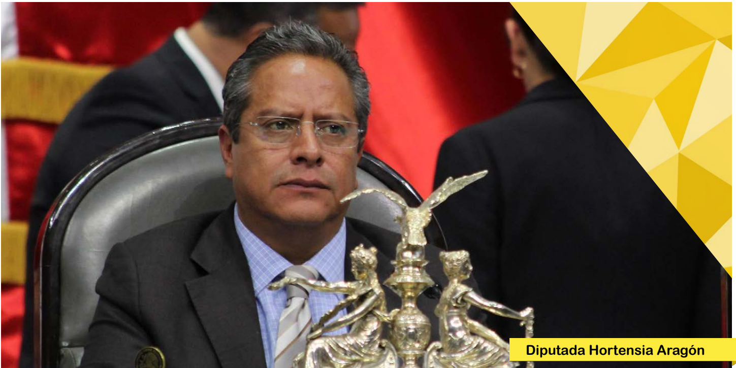
Diputada Hortensia Aragón