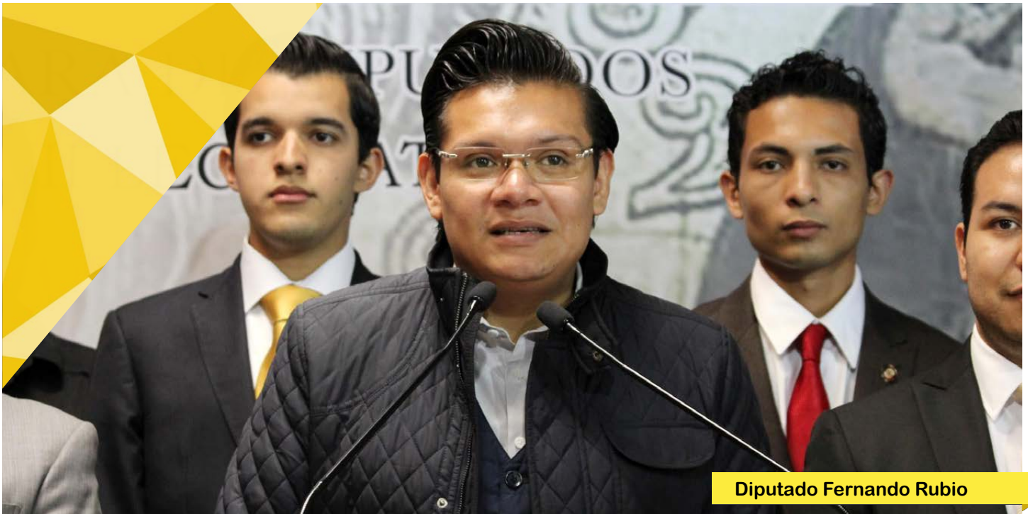
Diputado Fernando Rubio