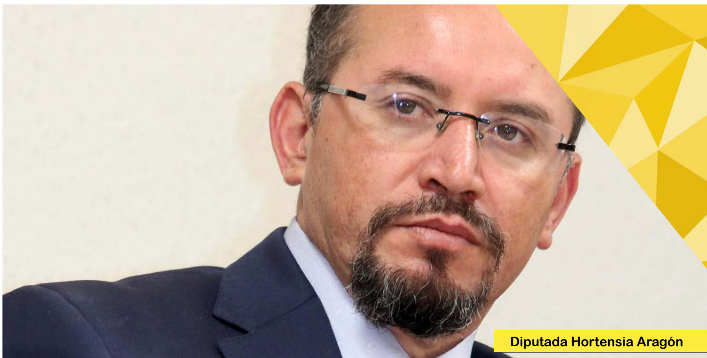
Diputada Hortensia Aragón