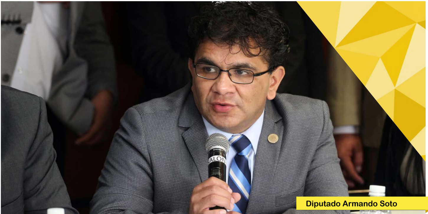
Diputado Armando Soto