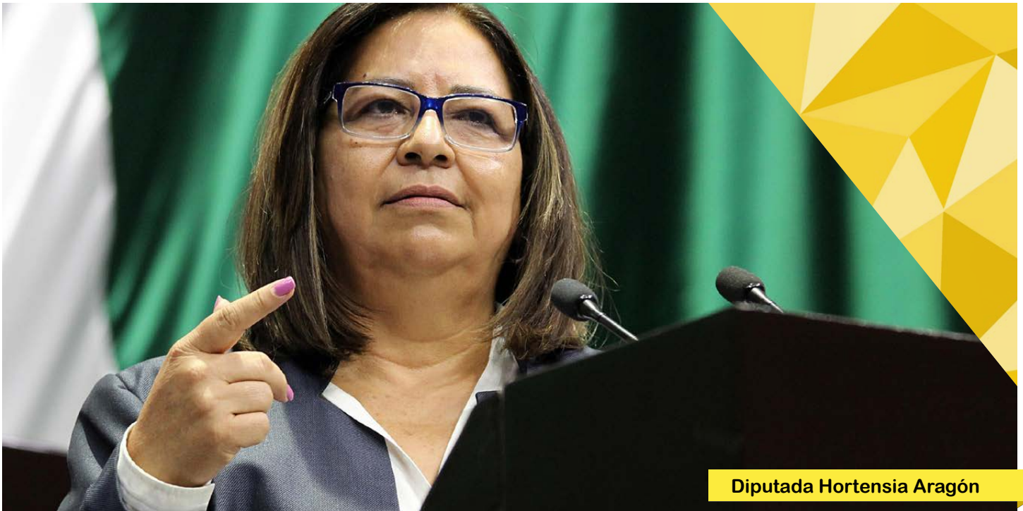
Diputada Hortensia Aragón