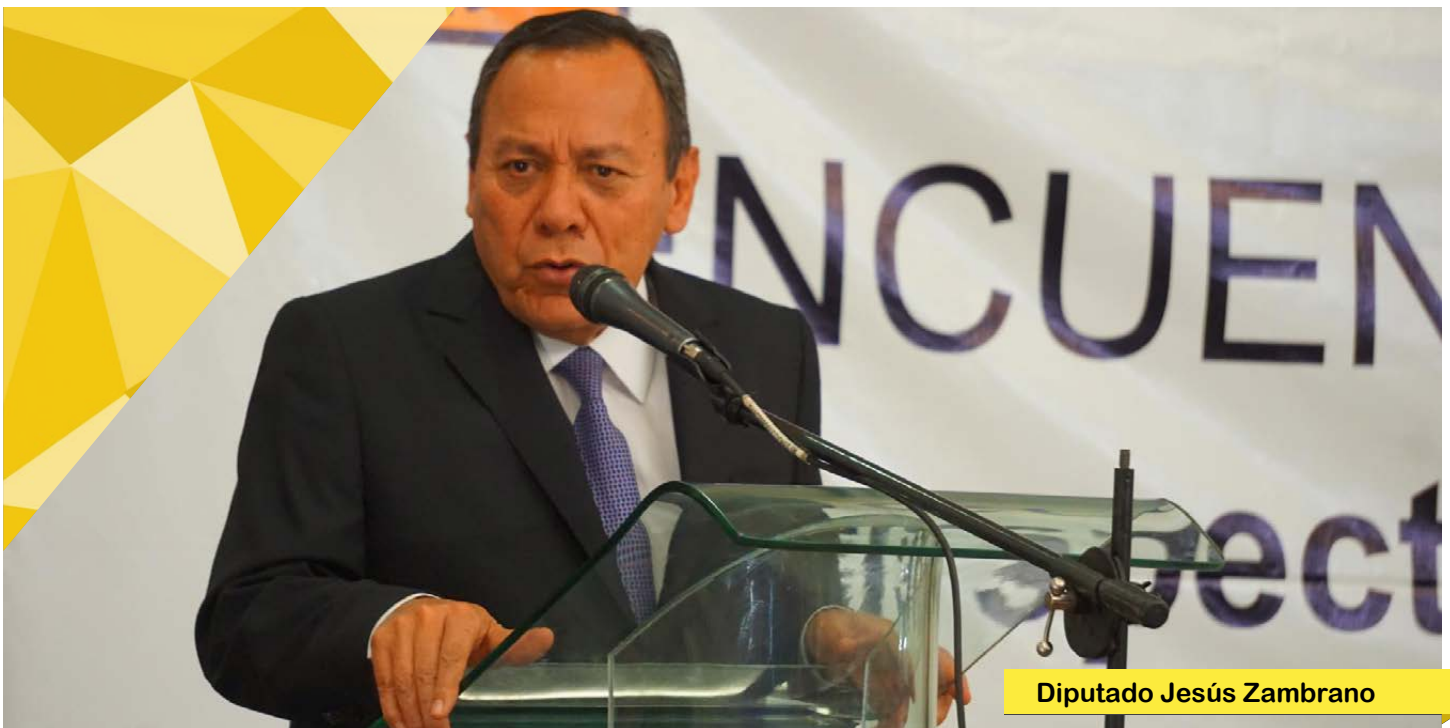
Diputado Jesús Zambrano