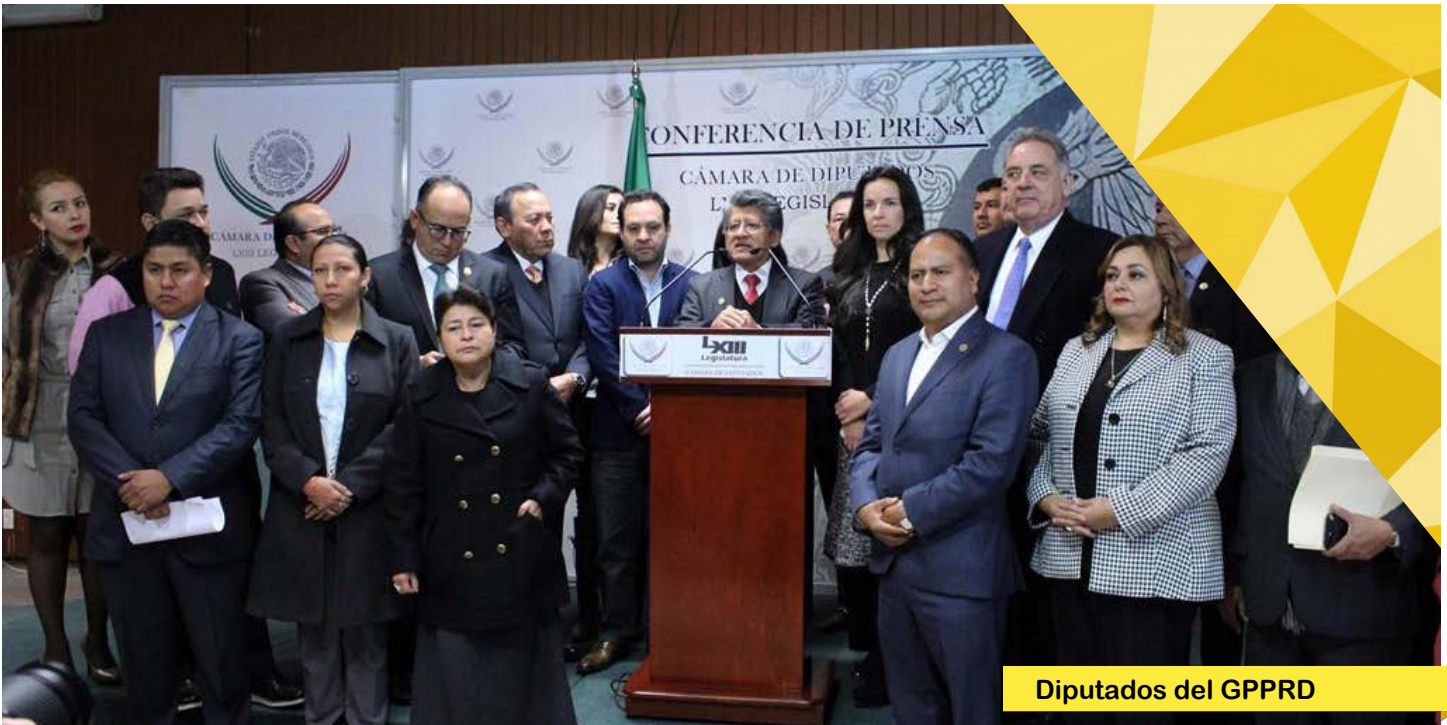
Diputados del GPPRD