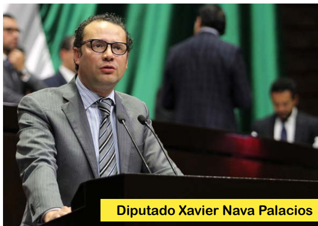
Diputado Xavier Nava Palacios