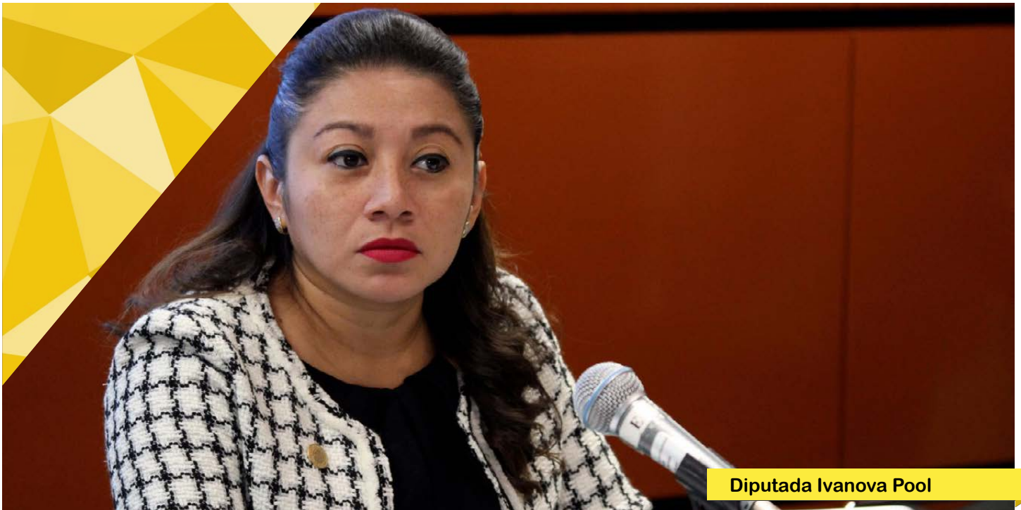
Diputada Ivanova Pool