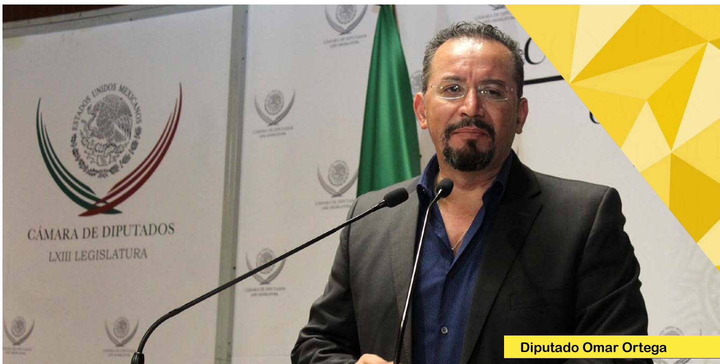
Diputado Omar Ortega